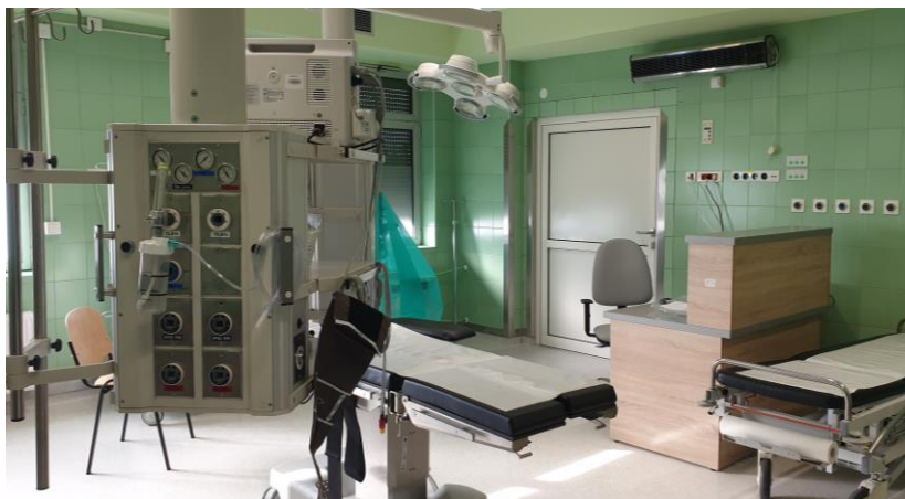
zdj. sali resuscytacji 2 powykonawczo

W ramach projektu zakupiono: sprzęt i aparaturę medyczną z przeznaczeniem na wykorzystanie w Szpitalnym Oddziale Ratunkowym, specjalistyczną aparaturę medyczną dla dwóch stanowisk wstępnej intensywnej terapii oraz wyposażenie socjalno-bytowego.