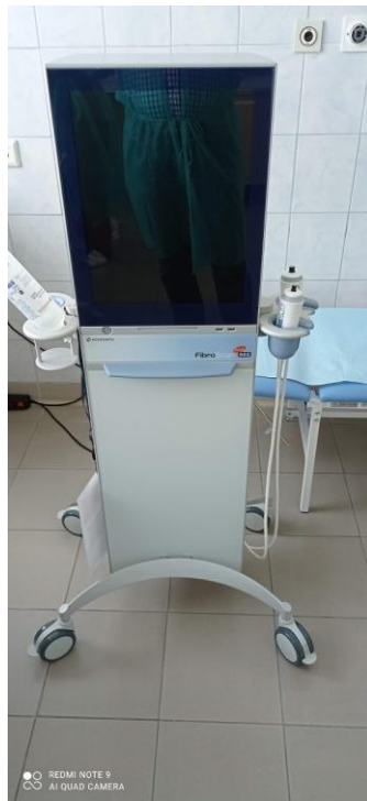
WYD021 Aparat do elastografii