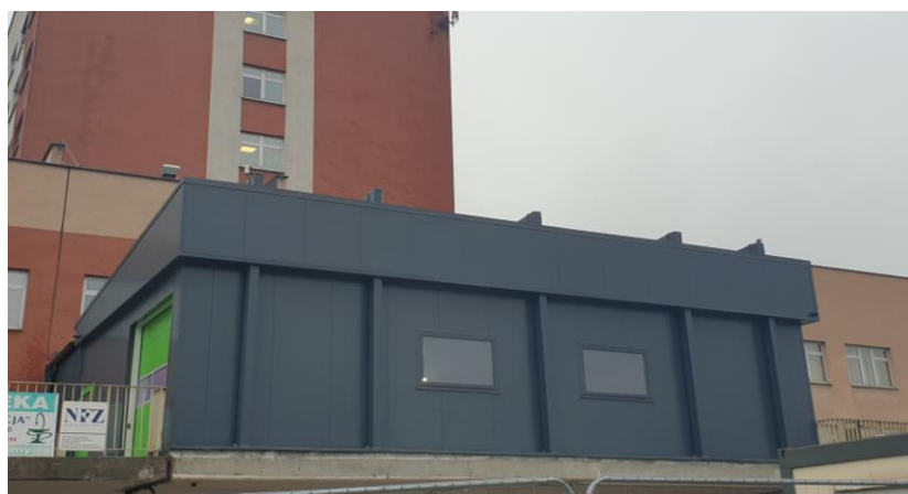
zdj. wiaty wjazdowo – postojowej powykonawczo