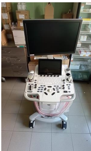
WYD003 Aparat USG