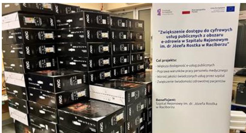
zdj. 170 zestawów komputerowych

Zadania dotyczące sprzętu IT (w tym serwery) również został już zrealizowany, na ukończeniu jest natomiast wdrożenie e-usług.