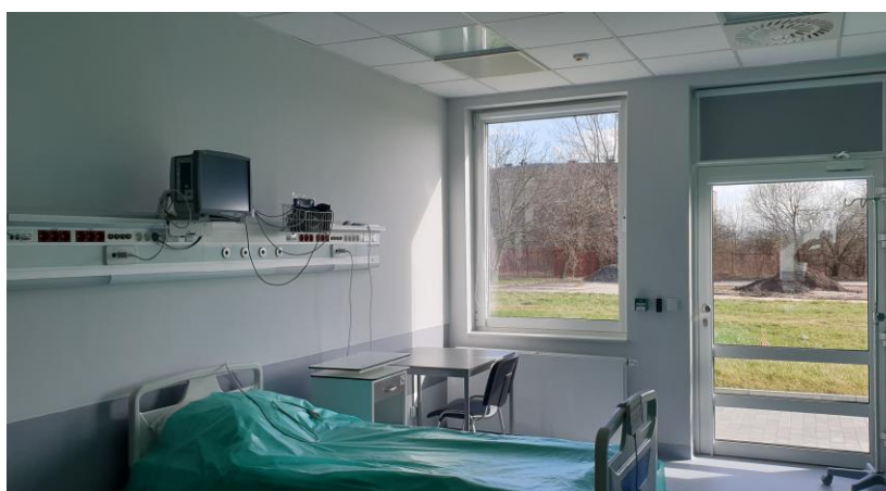
zdj. izolatki powykonawczo