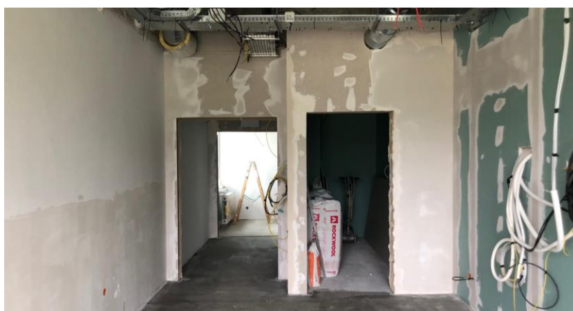
zdj. pomieszczenia w trakcie realizacji