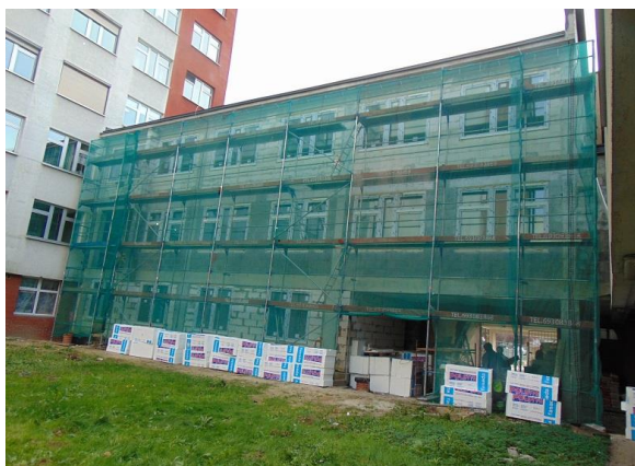
zdj. elewacji bloku C1 w trakcie realizacji

W związku z pandemią koronawirusa roboty budowlane były zawieszane, plac budowy przekazano Wykonawcy w dniu 02.08.2021r.