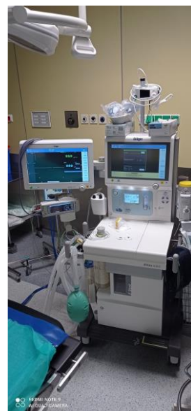
WYD038 Aparat do znieczulania