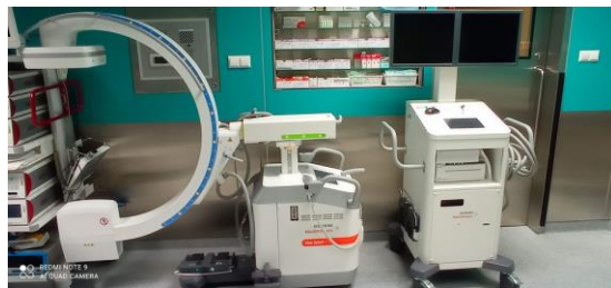
WYD27 Aparat RTG