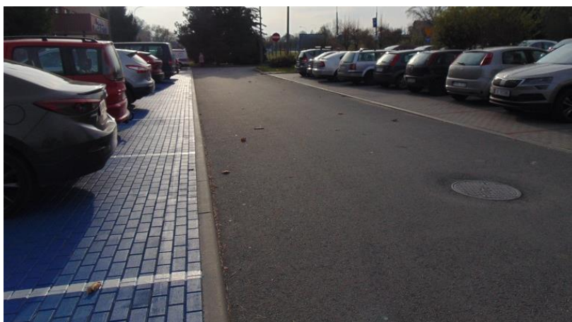
zdj. drogi i parkingu powykonawczo