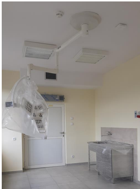
zdj. pomieszczenia SOR-u w trakcie realizacji