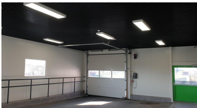
zdj. wiaty wjazdowo – postojowej powykonawczo