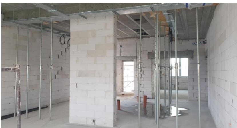
zdj. pomieszczenia w trakcie realizacji

Wartość inwestycji dodatkowych wyniosła: 334 156,97 zł. Niniejsze dopełniające realizacje wpłynęły na przekroczenie kwoty dofinansowania i podniesienie wartości całego projektu. Należy jednak zaznaczyć, iż ich wykonanie przełożyło się w sposób istotny na poprawę funkcjonowania całego Oddziału oraz pracy personelu Szpitalnego ze szczególnym wpływem na jakość oraz bezpieczeństwo świadczonych usług medycznych.