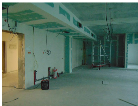
zdj. pomieszczenie SOR-u wysoki parter w trakcie realizacji