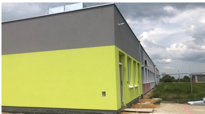
zdj. elewacji z tyłu budynku powykonawczo