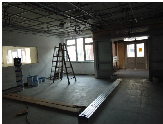
zdj. hallu wejściowego SOR w trakcie realizacji