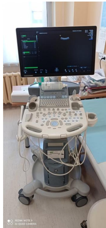
WYD064 Aparat USG