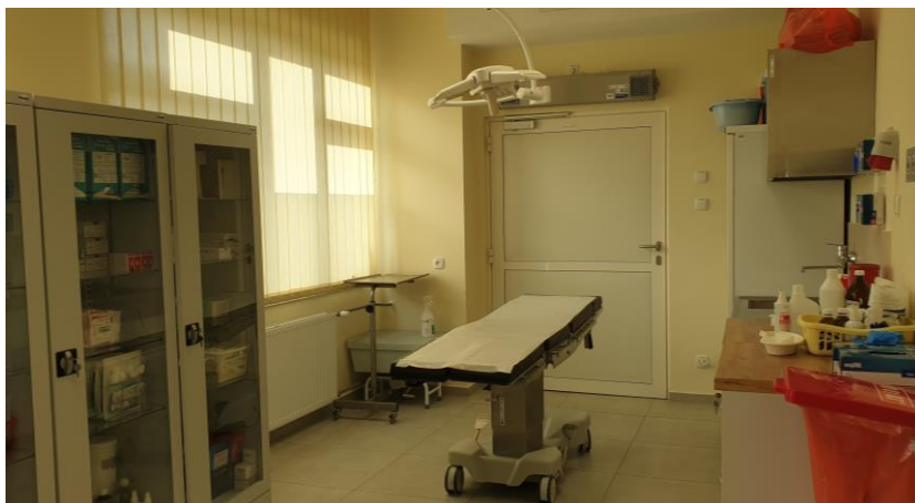
zdj. gabinetu opatrunków gipsowych – zabiegowy powykonawczo