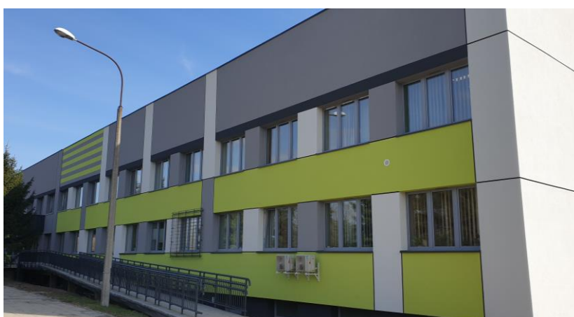
zdj. elewacji powykonawczo

W III kwartale 2023 r. zostały wykonane postępowania na zamówienia publiczne na pozostałe zadania wynikające z projektu, celem wyłonienia Wykonawcy robót budowlanych.