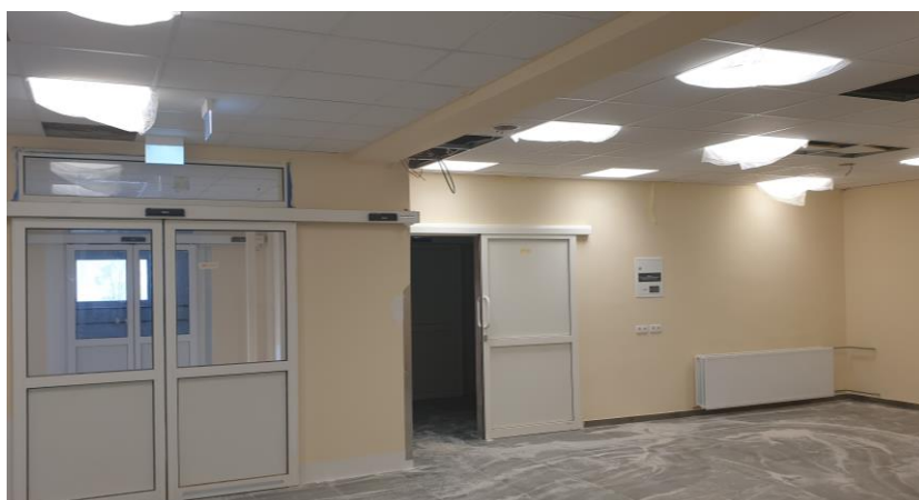
zdz. pomieszczenia SOR-u w trakcie realizacji