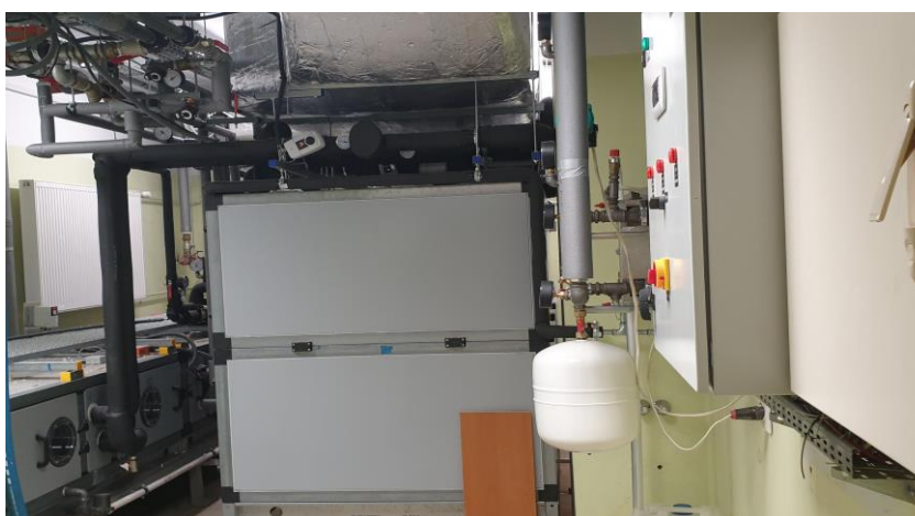
zdj. zespołu klimatyzacyjno-wentylacyjnego powykonawczo