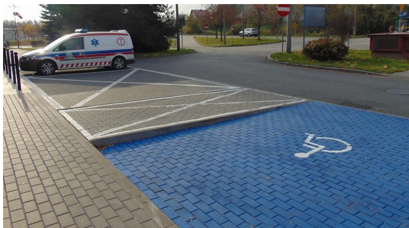
zdj. terenu przed Przychodnią Zdrowia powykonawczo

Koszt robót wyniósł 352 652,03 zł , został sfinansowany ze środków dotacji Powiatu Raciborskiego w wysokości 300 000,00 zł i własnych Szpitala w wysokości 52 652,03 zł .