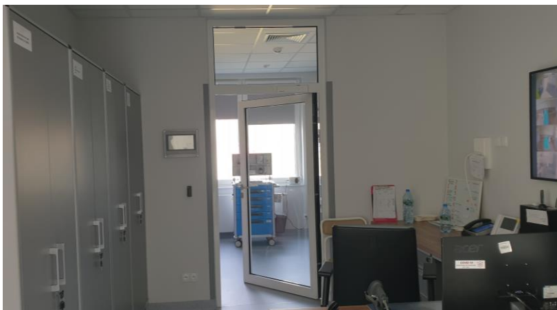
zdj. posterunku pielęgniarek powykonawczo