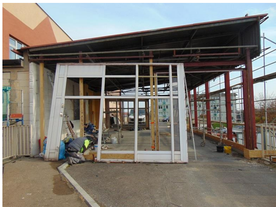
zdj. wiaty wjazdowo – postojowej w trakcie realizacji