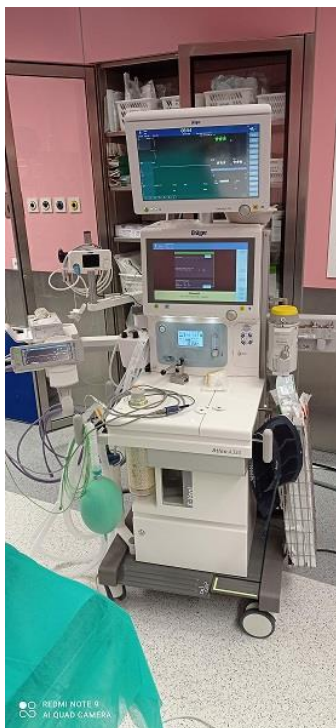
WYD001 Aparat do znieczulania