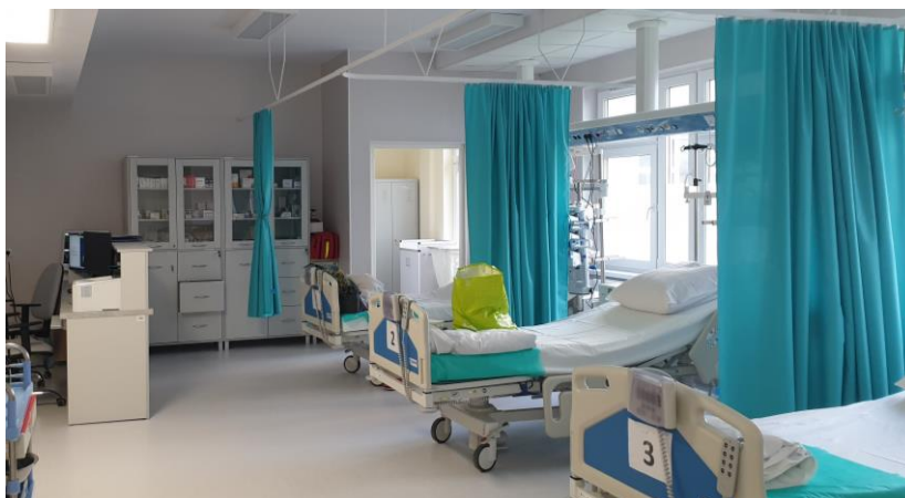
zdj. sali obserwacyjnej 4 stanowiskowej powykonawczo