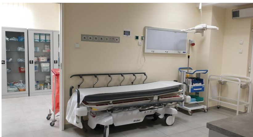
zdj. gabinetu opatrunków gipsowych powykonawczo