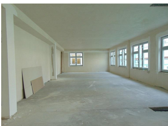
zdz. pomieszczenia na potrzeby neonatologii (I piętro) w trakcie realizacji