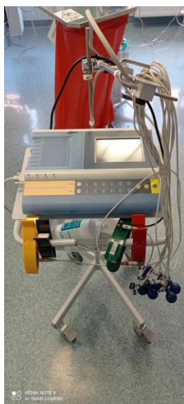
WYD023 Aparat EKG