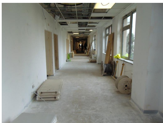
zdz. korytarza SOR-u niski parter w trakcie realizacji