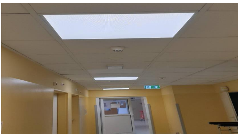
zdj. wymienionych lamp w korytarzach powykonawczo

W dniu 30.12.2022 r. została podpisana umowa na wymianę oświetlenia na nowoczesne oświetlenie LED w całym obiekcie. Wartość zadania to: 3 707 645,58 zł . Termin realizacji wynosił 12 miesięcy.