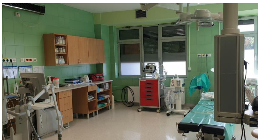
zdj. sali resuscytacji 1 powykonawczo