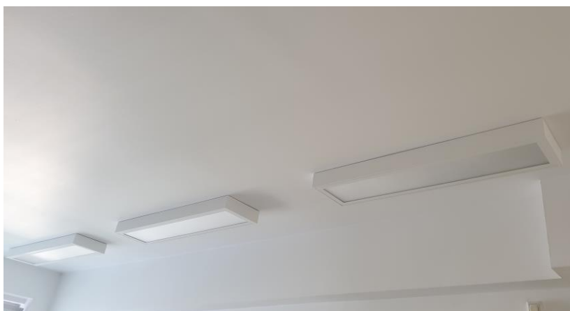
zdj. wymienionych lamp w gabinetach zabiegowych powykonawczo