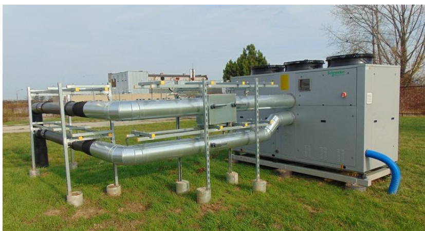
zdj. agregatu wody lodowej dla Oddziału Zakaźnego powykonawczo

Celem inwestycji była poprawa warunków pobytowych dla pacjentów ponieważ oddział jest tak usytuowany, iż sale w których przybywają pacjenci znajdują się od strony bardzo mocno nasłonecznionej co w konsekwencji powoduje, że temperatura w okresach letnich jest wysoka.