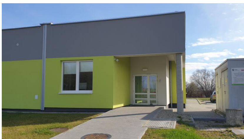
zdj. elewacji wraz z podjazdem z przodu budynku powykonawczo