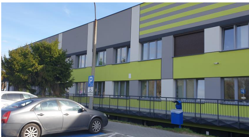
zdj. elewacji powykonawczo