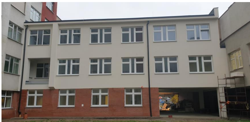
zdz. elewacji w trakcie realizacji